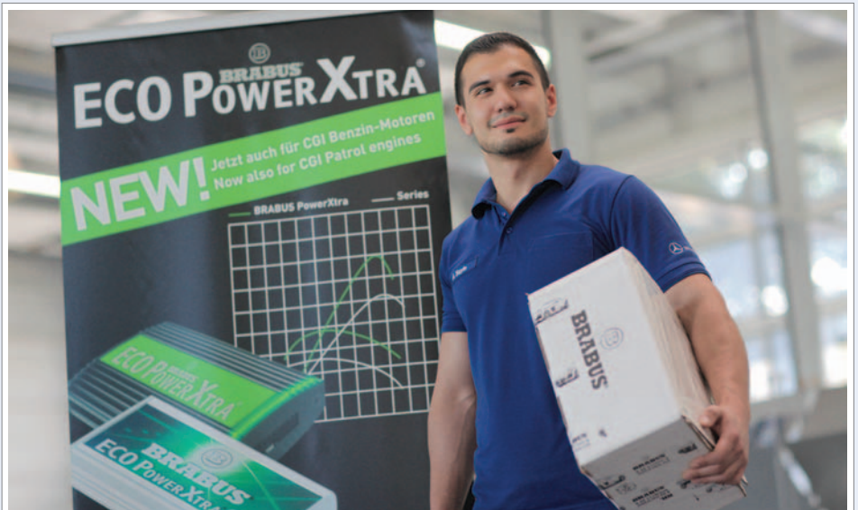
TUNING-EXPERTE: Seit 2010 ist das Autohaus Weitkamp BRABUS Kompetenz-Händler.