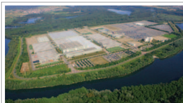
GRÖSSTES AUTOMOBILES ERSATZTEILLAGER DER WELT: GLC in Germersheim.

Das Mercedes-Benz Global Logistics Center ist mit über einer Million Quadratmeter Lagerfläche das größte Lager für automobile Ersatzteile weltweit. 2.800 Mitarbeiter sorgen täglich für die schnelle Teileversorgung der Kunden weltweit. Das Teilesortiment des Zentrallagers und seiner Außenstandorte umfasst ca. 530.000 verschiedene Teile der Marken Mercedes-Benz, Maybach, smart und Mitsubishi FUSO.