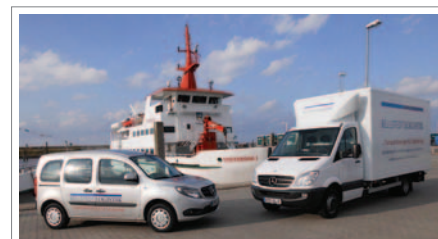
AUF DEM FESTLAND IM EINSATZ: Mercedes-Benz Sprinter und Citan aus dem Hause Weitkamp.

Neben dem Logistikunternehmen betreibt das Ehepaar Bellstedt noch ein Teehandelskontor auf Spiekeroog.