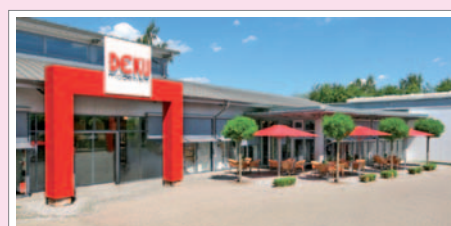
MODE-EINKAUFSPARADIES: Die DEKU-Modewelt in Lemförde.